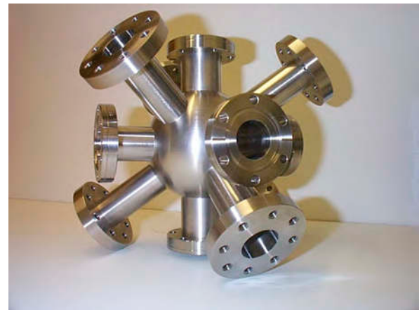
Für diese Kammer war eine besonderes hohe Genauigkeit der Maße gefordert - Sonderanfertigung mit kundenspezifischen Flanschen