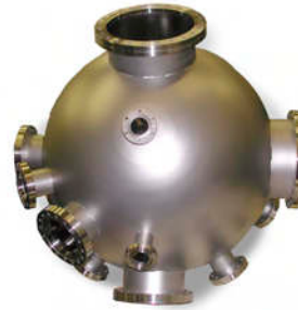
Kugel-Kammern werden hergestellt aus gedrückten Edelstahl-Halbschalen - eine typische Bauform für die Oberflächenforschung