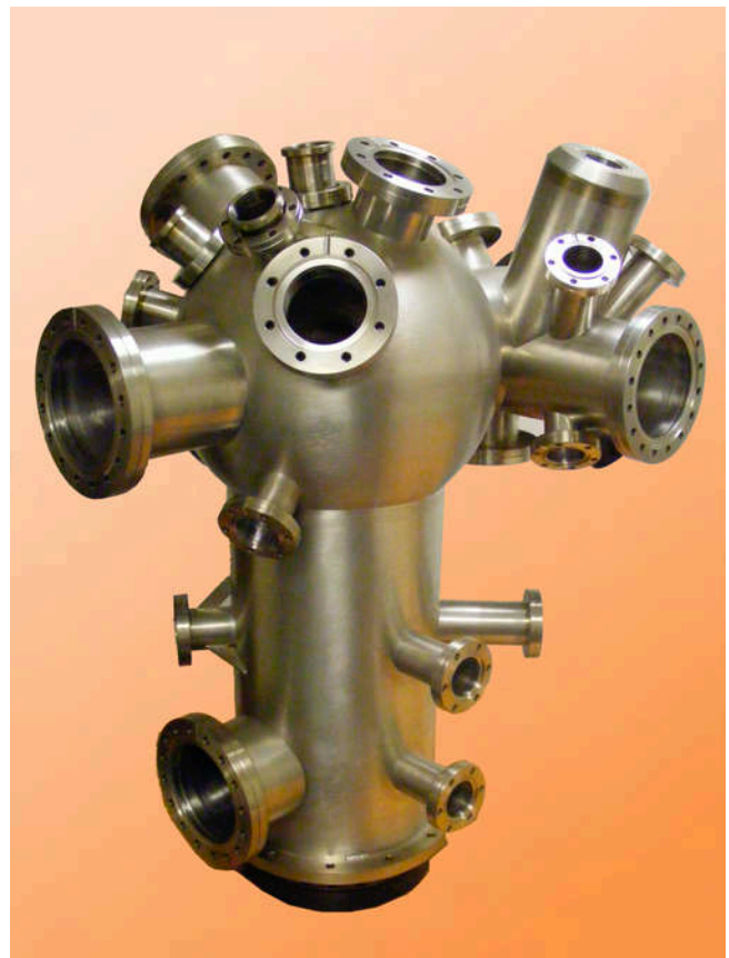
Große Mu-Metall Kammer

Diese sind aus 5 mm starkem Mu-Metall gebaut, um eine ausreichende Festigkeit zu erhalten. Sorgfältige Planung ist notwendig, weil Mu-Metall deutlich weicher als Edelstahl ist.