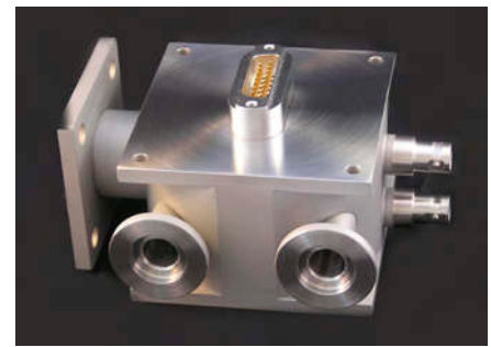
Kleine Kammer für den industriellen Gebrauch mit integrierter Sub-D Durchführung.