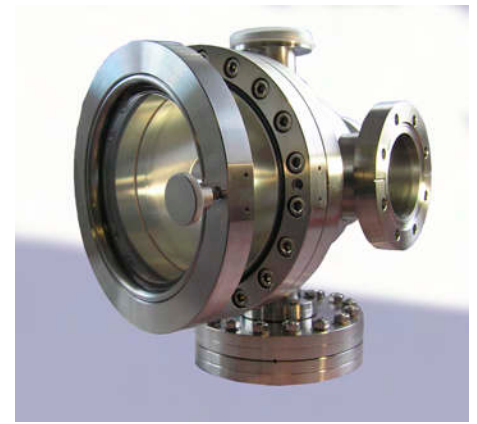
FEL Kammer mit Schnellverschluss-Tür einschl. Sichtfenster

(Siehe Spezifikation auf Section 9 für QADs.)